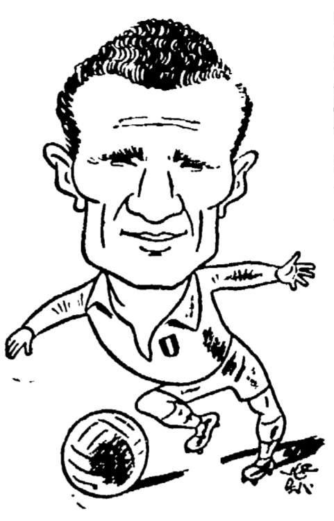
Il capitano del Torino, Mazzola, visto da Verdini

L'incontro Torino-Juventus occupa il primo posto nel cartellone della quinta giornata. La scorsa settimana fu necessario attendere le ultimissime battute del torneo per conoscere la squadra campione e fu proprio l'incontro diretto Torino-Juventus, vinto dai granata alla penultima giornata, a riaffermare in giuoco quel titolo che ormai sembrava sicuro appannaggio dei bianco-neri juventini.