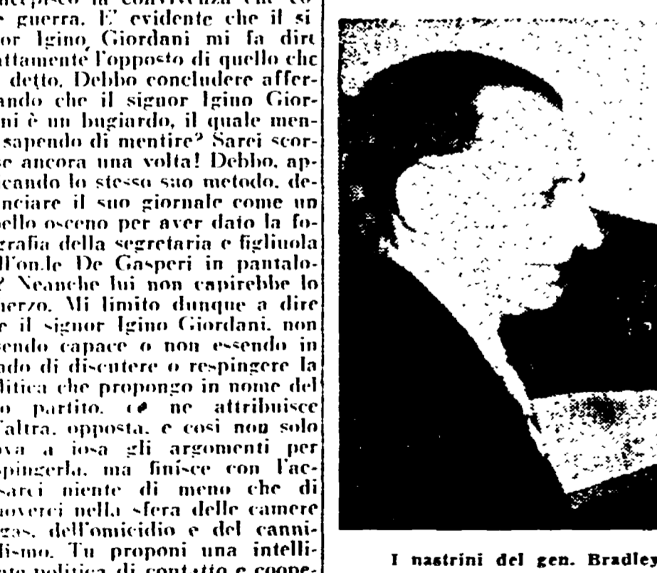
I ministri del gen. Bradley interessano l'on. De Gasperi

Documenti «Questa propaganda (dei comunisti) è molto efficace, specialmente negli Stati Uniti...»