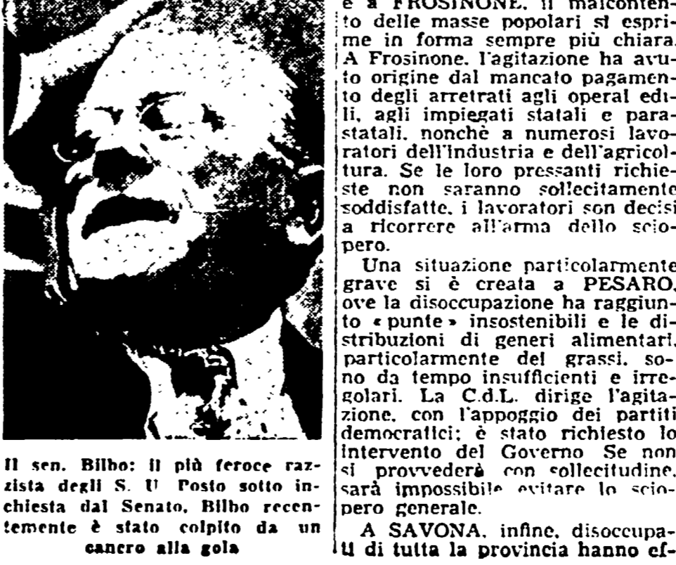
Il sen. Bilbo: il più feroce razzista degli S. U. Posto sotto inchiesta dal Senato, Bilbo recentemente è stato colpito da un cancro alla gola