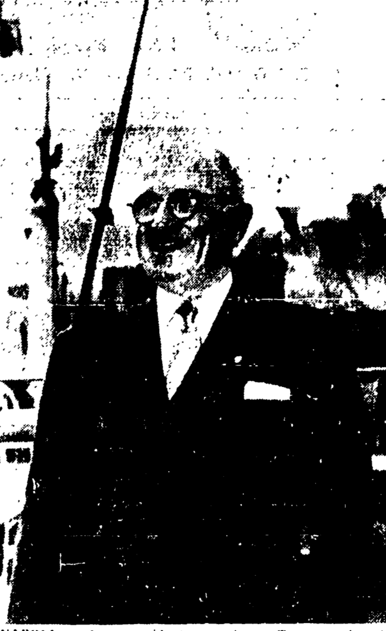
NAPOLI — L'ex presidente americano Truman, che sta completando un viaggio di piacere, è arrivato ieri a Napoli col transatlantico "Independence".