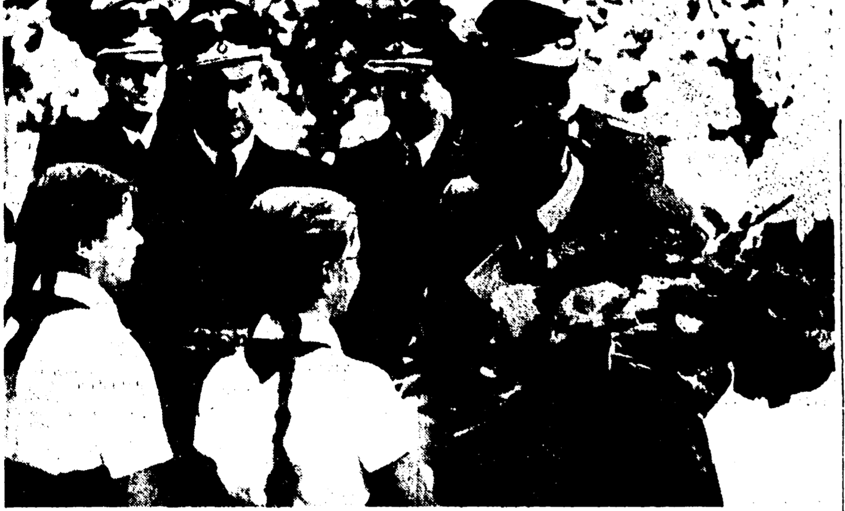
Globke, attuale ministro della Germania di Bonn (indicato dalla freccia) in divisa nazista al seguito del criminale di guerra Frick e al sindaco fantoccio di Bratislava in una foto scattata nel 1941 nella Cecoslovacchia occupata dai nazisti

Lo sterminio degli ebrei slovacchi portato a termine con fredda ferocia dal braccio destro di Adenauer