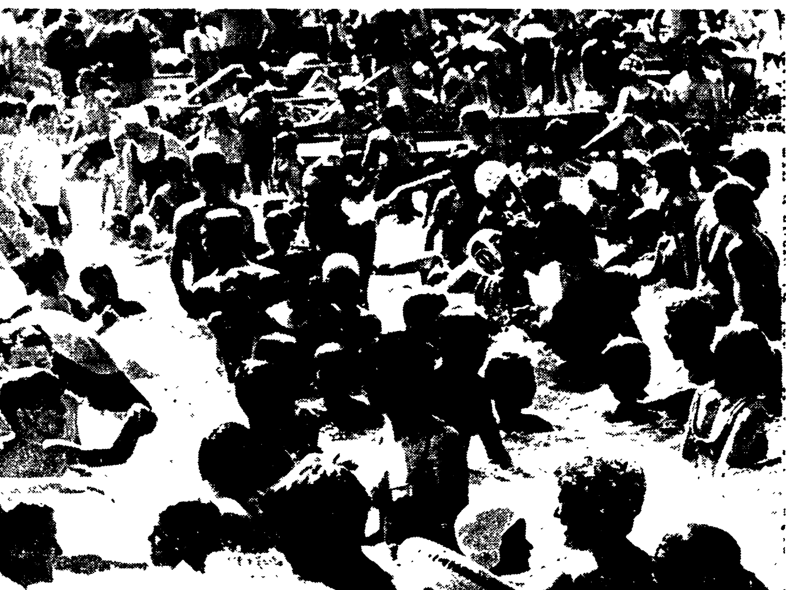
FRANCOFORTE — E' arrivata l'estate, il caldo è piombato improvvisamente in quasi tutta l'Europa. La prima giornata canicolare di questo 1967 ha fatto riversare migliaia di persone sulle spiagge, sui monti, nelle piscine. La ricerca di un po' di refrigerio, per ripararsi dall'aria afosa, ha raccolto ad esempio nella principale piscina di Francoforte centinaia di cittadini.