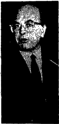
Ciriaco De Mita