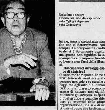
Nella foto a sinistra Vittorio Foa, uno dei capi storici della Cgil, già deputato della Costituente

diamante ci circonda. Però Occhetto ha detto che Trentin è stato ricattato dal governo, svalutando la sua scelta... Occhetto è il segretario del partito a cui io appartengo, ma ha tutto il diritto di pensarla diversamente da me. E perché Occhetto riveda le dimissioni Trentin? Io penso che non abbia apprezzato tutta la gravità della situazione economico-finanziaria. Trentin è l'ultimo dei dirigenti sindacali che ha lavorato con il Pds di Vittorio. Era più semplice fare il sindacalista allora? Io, Lama e Trentin siamo i tre sindacalisti, ancora vivi, che hanno lavorato di più con Di Vittorio. Allora erano diverse le difficoltà che dovevamo affrontare, trovandoci di fronte a governi e imprese fortemente aggressivi. I nuovi sindacalisti che identifi hanno? La generazione dei prossimi dirigenti sindacali avrà come punto di riferimento non una calla fedeltà e delle idee ma la capacità di vivere i cambiamenti e affermarne i valori. Questa vicenda non allontana il sindacato dalla gene-