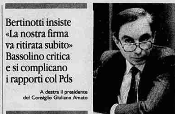
Bertinotti insiste «La nostra firma va ritirata subito» Bassolino critica e si complicano i rapporti col Pds

A destra il presidente del Consiglio Giuliano Amato