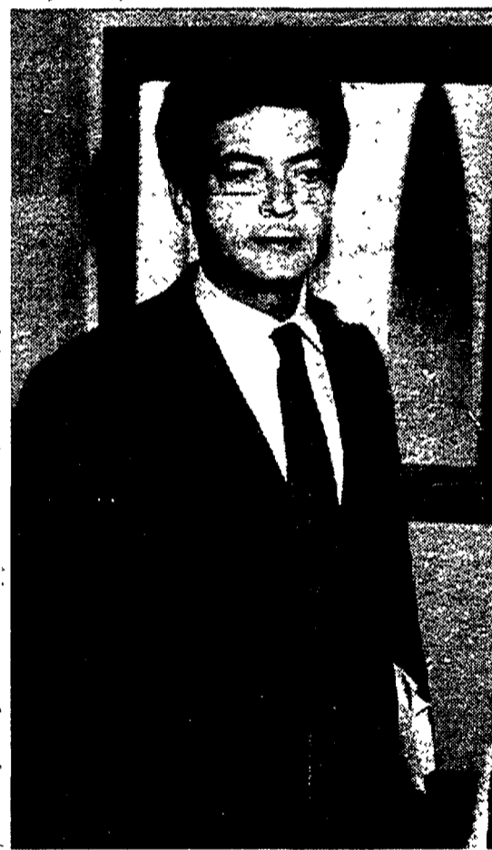
Il ministro Claudio Martelli

Ma da questo punto di vista il Psi fa, almeno all'apparenza, muro. «Non desideriamo affatto fare polemiche - dice Giuliano Amato - la nostra intenzione è un'altra ed è solo quella di precisare ciò che ci sembra doveroso. I dirigenti del Pds salutano come una grande vittoria un risultato elettorale dal quale sono usciti con una perdita di oltre dieci punti e più di 70 deputati. Non ci riguarda e non obiettiamo: cuor