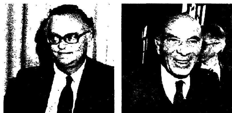
Guido Carli, ex ministro del Tesoro, a sinistra, Franco Reviglio, ministro del Bilancio

Privatizzazioni e interessi. Dismettendo in tutto o in parte le proprie aziende, in tre anni lo Stato dovrebbe incassare 42mila miliardi. Oltre al dato puramente contabile, però, Reviglio sottolinea che il governo sta cercando di modificare «in molti punti la stessa logica della presenza e dell'intervento pubblico in economia». I suoi predecessori, Carli in particolare, si erano spinti anche più in là, parlando di «fine del socialismo reale» all'italiana. È andata a finire che Amato ha dovuto presentare un nuovo progetto, che a sua volta ha dovuto fare i conti, soccombendo, con una buona parte della Dc. Diverso il discorso sulla spesa per interessi: lo Stato pensa di risparmiare nel prossimo anno circa 4.500 miliardi. Di questi tempi, più che di un «segnale», si tratta di un atto di fede.