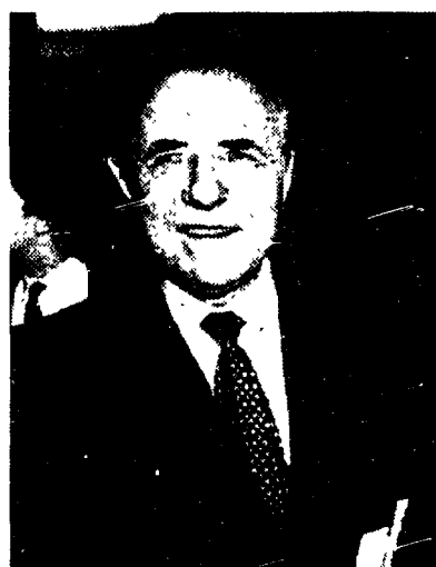
Carlo Azeglio Ciampi, governatore della Banca d'Italia

colo era scuola di emigrazione e di spazzacchini ma che in qualche decennio ha bruciato le tappe meglio di Miguel Indurain a un cronometro. Un'ex Cenerentola che senza sposare alcun principe è saldamente salita all'ottavo posto con un biglietto da visita da 16.479 miliardi. Una cifra che fa scivolare sotto di trecento miliardi Genova che deve consolarsi stando sopra di 500 a Bari, ultima delle dieci reginette. Attenzione però. L'andazzo cambia se a «giocare» sono solo i risparmi di quelle che la Banca d'Italia definisce «famiglie consumatrici». Certo, Milano e Roma, rimangono prime ma in questo caso Genova si riprende subito la sua rivincita. E confermando una non tanto leggendaria vocazione sparagnina balza al sesto posto calciando giù le altre. Non solo. Così riesce a entrare - e alla grande - anche Verona che con 7.823 miliardi costringe Bergamo a uscire dalla classifica. Un asso veneto contro il tris lombardo.