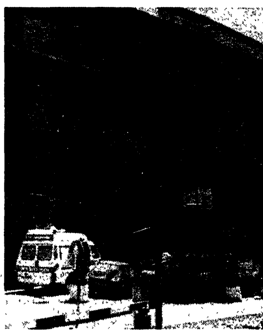
L'ingresso dell'ospedale Umberto I di Roma

Ma le accuse agli emendamenti governativi sulla sanità non finiscono qui. Sotto tiro c'è anche la norma che modifica il meccanismo di attribuzione alle Regioni dei contributi sociali riscossi nel loro territorio. Oggi le procedure di finanziamento della sanità alla struttura economica e occupazionale del paese, con in più l'effetto perverso di un probabile aumento dei contributi