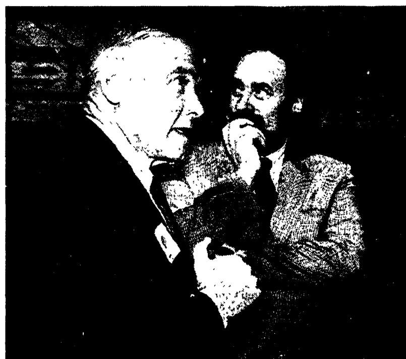
Bruno Trentin con Ottaviano Del Turco

Sarà possibile una soluzione unitaria? Un auspicio in questo senso viene da un editoriale di Ottaviano Del Turco che apparirà su «l'Avanti!» di oggi. Il dirigente sindacale si sofferma sulle scadenze d'autunno «in vista di una Finanziaria che sarà, inevitabilmente, tra le più dure della storia recente del Paese». E allora sarà necessario assumere decisioni «prese in condizioni di assoluta emergenza». Un ragionamento che sembra in qualche modo voler motivare la sofferta firma al protocollo di luglio, anche in