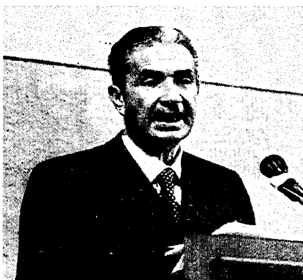
Aldo Moro

ROMA. L'ha trovata la sua collocazione il busto di Aldo Moro. Nella sala gialla, tra le più solenni di palazzo Montecitorio, a fianco della sala della Lupa. Il bronzo col volto assorto dello statista democristiano, la stessa espressione che l'Italia ha conosciuto sui manifesti che ne annunciavano il martirio in una prigione delle Brigate rosse, trova finalmente una «degnata collocazione», dopo aver rischiato di finire in qualche anonimo angolo o - peggio - in uno scantinato.