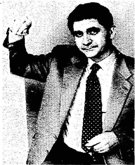
Rocco Buttiglione

Da oggi le assise. Fra Buttiglione e Bianchi torna il nome di Mancino, che potrebbe contare sul sostegno di De Mita