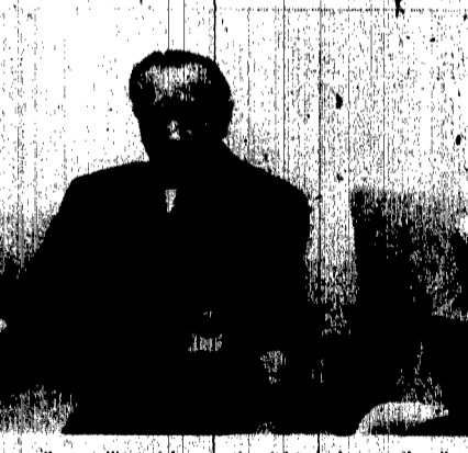
Bonn: il cancelliere Adenauer (a sinistra) durante il colloquio di ieri con il presidente della Germania federale, Luebbe.

non vuole neppure sentir parlare di un quinto governo Adenauer; dall'altra non se la fa di mantenere il posto in opposizione, in un momento nel quale — per le più diverse e magari contraddittorie ragioni — mezzo mondo lo vuole al governo. Non poteva, quindi, che fare buon viso a cattivo gioco e supplicare il Cancelliere di non impuntarsi.