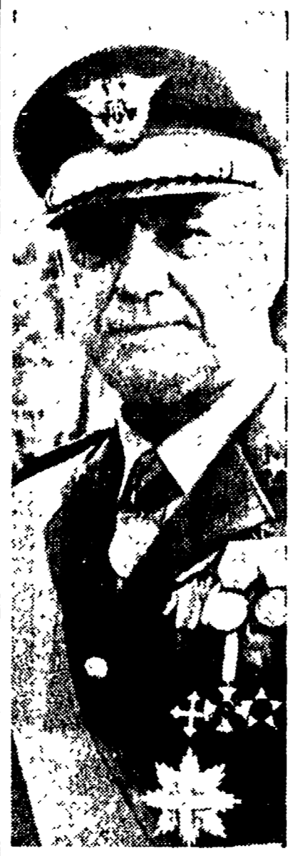
Il generale Vedovato.

Col pretesto dell'«umiliazione» delle Forze Armate, che nessuno ha attaccato, il generale copre le gravi responsabilità governative. Un incauto commento del «Popolo»