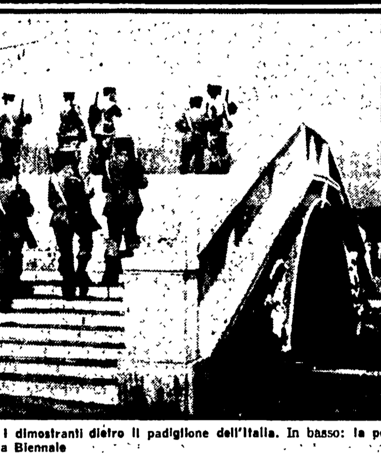
VENEZIA - Nella foto in alto: I dimostranti dietro il padiglione dell'Italia. In basso: la polizia in assetto di guerra blocca la Biennale