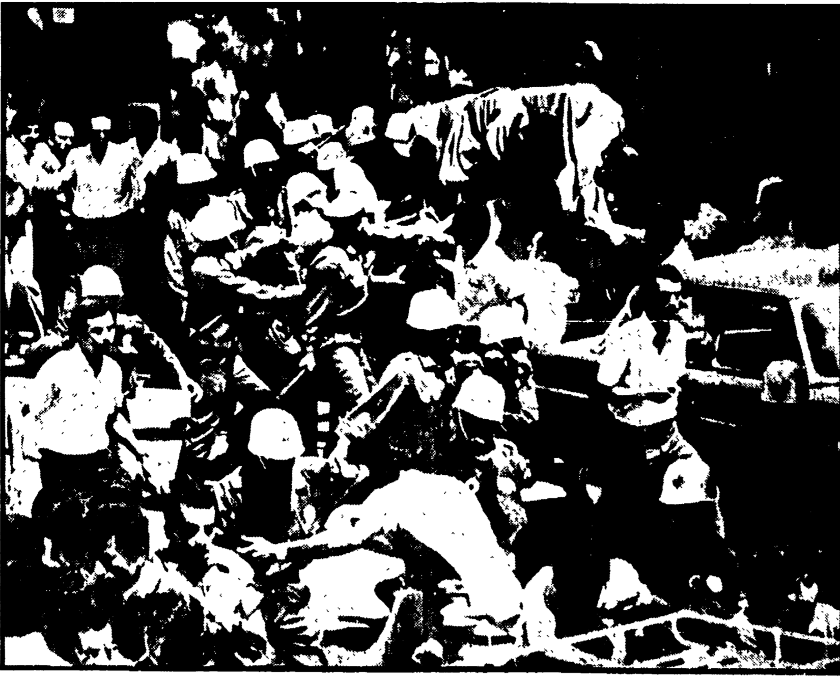
ISTANBUL: «FUORI GLI USA» L'ondata delle manifestazioni contro la Sesta Flotta americana e contro le brutalità poliziesche non accenna ad esaurirsi in Turchia. Unità dell'esercito sono state poste in stato d'allarme.