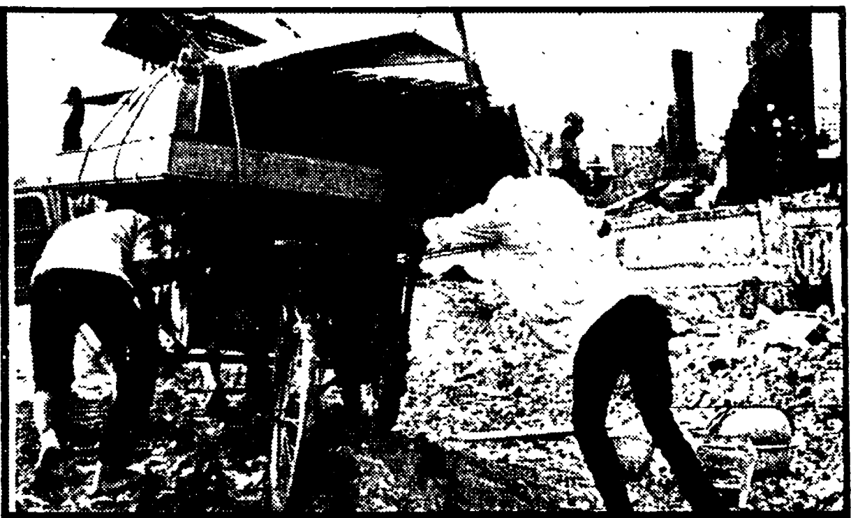
SAIGON - In sinistrall fuggono da uno dei quartieri meridionali, distrutti dai bombardamenti e dagli incendi

Sempre più complicata la crisi politica del regime fantoccio di Saigon - Una nave britannica attaccata con razzi lungo il canale che collega la capitale al mare