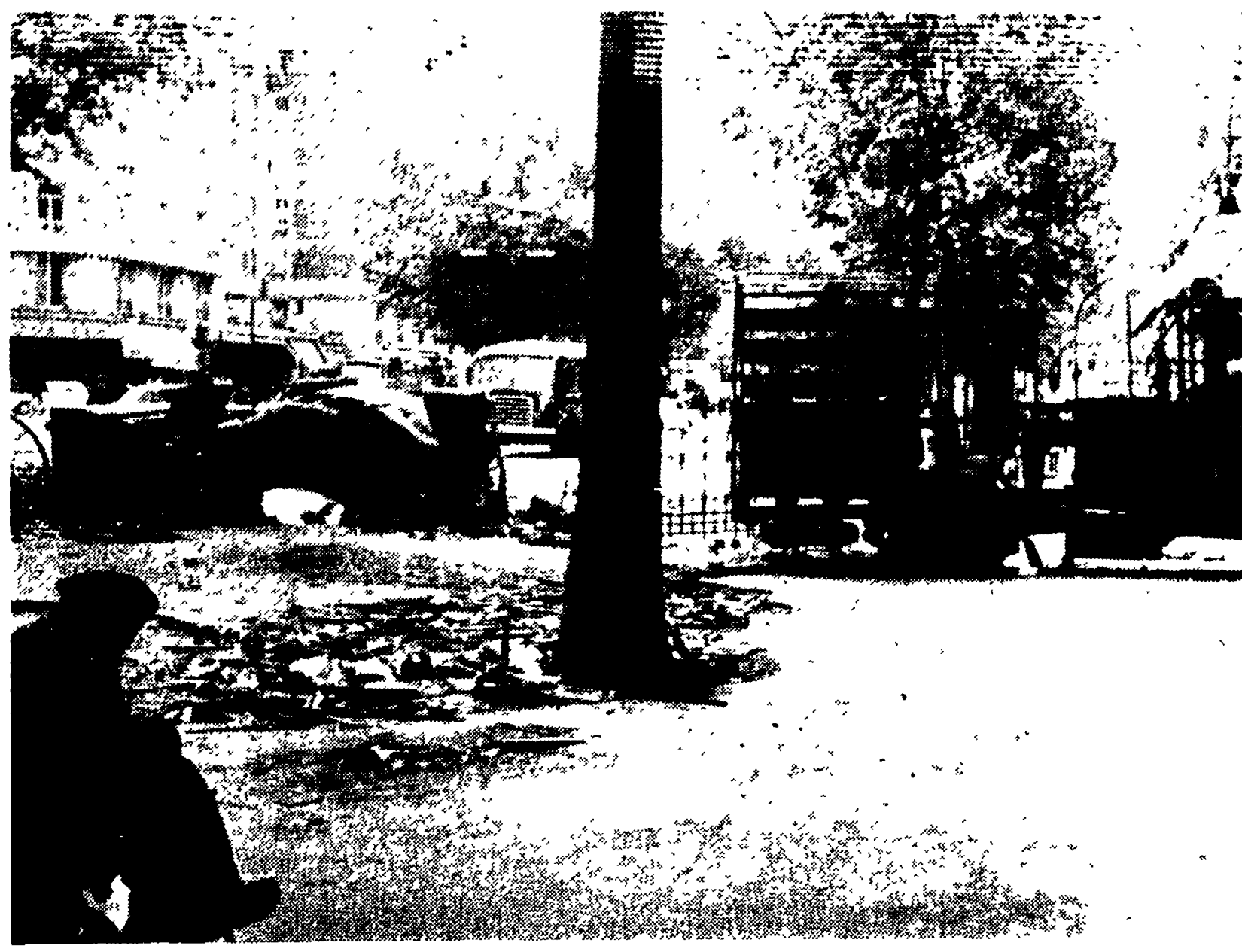
PARIGI — Il Boulevard St. Germain dopo gli scontri della notte tra venerdì e sabato fra studenti e polizia.

Il PCF insiste affinché le sinistre unite diano subito alle masse una prospettiva chiara e concreta sulla base di un programma comune - I sindacati chiamano i lavoratori a proseguire gli scioperi per sostenere i loro rappresentanti nelle trattative tuttora in corso - Anche la TV ha sospeso il lavoro a tempo indeterminato per protesta contro il servilismo filo-governativo della direzione - La battaglia contro il referendum