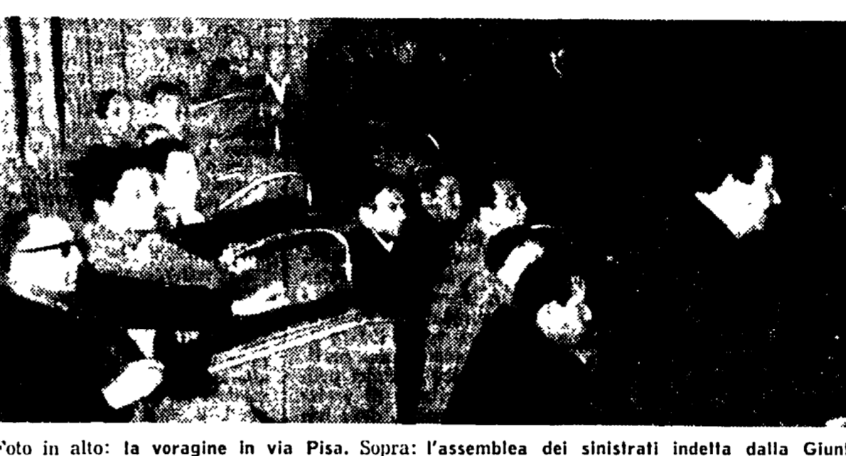
Foto in alto: la voragine in via Pisa. Sopra: l'assemblea dei sinistrati indetta dalla Giunta

Immedie misure predisposte dall'Ufficio tecnico comunale e dall'ENEL - Le famiglie costrette ad abbandonare le loro case sono state sistemate in parte negli alberghi - Inchieste del Comune e della magistratura