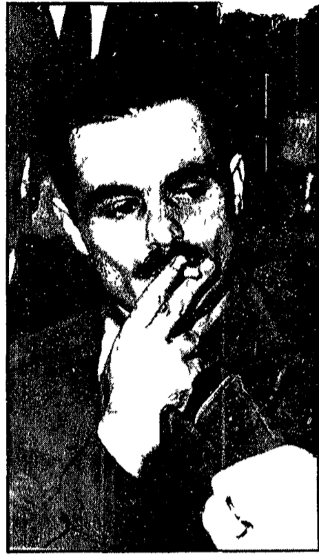
Alexandros Panagulis ascolta la sentenza con cui il tribunale militare di Atene, espressione del regime dei colonnelli fascisti, lo ha condannato a morte... come sottolinea l'interrogazione che i deputati del PCI hanno rivolto al presidente del Consiglio on Leone...

Riassetto, riforma, ENPAS e libertà al centro dell'azione unitaria - Le modalità dell'astensione dei ferrovieri e postelegrafonici - Esentate le zone alluvionate - Assicurati i servizi di emergenza - Manifestazioni unitarie nel Paese (A pag. 2)