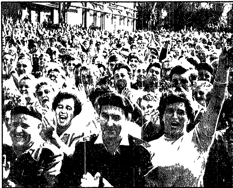
PILSEN - I lavoratori della Skoda applaudono calorosamente il Presidente della Repubblica Ludvik Svoboda durante la sua visita ai grandi stabilimenti automobilistici

Il governo ha approvato i risultati delle trattative Cernik-Kossighin a Mosca - Oggi si riunisce l'Assemblea nazionale per discutere le nuove leggi - Dubcek parla ai giovani