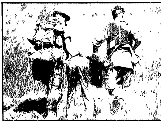
CU CHI - Due paracadutisti americani hanno catturato un patriota vietnamita e lo stanno trascinandolo brutalmente, con le mani legate dietro la schiena.

Nelle altre zone del Vietnam del Sud le forze partigiane sono state particolarmente attive. A Pleiku (a nord-ovest degli ultimi giorni di guerra) quattro mila americani furono colpiti da insidiosi colpi di mortaio e ne furono uccisi 1.000 e nel delta del Mekong dove una unità volta hanno bombardato i loro obiettivi e uccisero 1.000 uomini in un'azione di Can Tho. In entrambi i casi