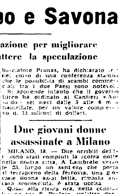
Due giovani donne assassinate a Milano

LA "DIPLOMAZIA DEL DOLLARO", SOTTO ACCUSA NEGLI S.U. Nuove rivelazioni dopo lo "scandalo Clayton" Il Ministro del Commercio e le miniere della Slesia Orientale - Forrester era in buoni rapporti con i trust tedeschi - E Schacht fu generosamente trattato a Norimberga