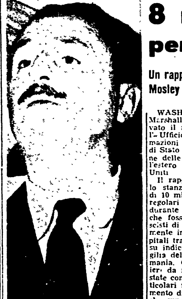
O. Mosley ha annunciato a Londra che l'organizzazione del nuovo partito fascista da lui diretto « il movimento d'unione » avrà inizio oggi.

Un rapporto dell'«Ufficio per i rapporti e le informazioni culturali del dipartimento di Stato», Mosley dirigerà l'organizzazione dell'Europa occidentale - Byrnes e i gruppi fascisti italiani