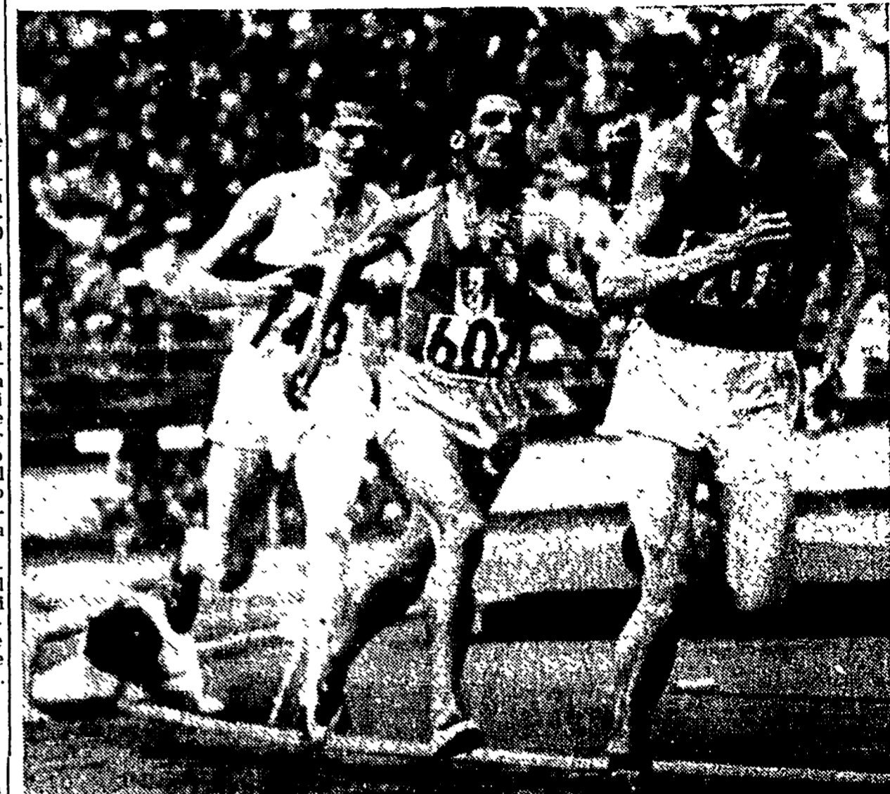
Zatopek nel finale dei 5000 metri ad Helsinki. La fatica di Emlt ha avuto ragione della disperata resistenza degli avversari - (LEGGETE IN 3a PAGINA LA NOSTRA INTERVISTA COL GRANDE CAMPIONE)