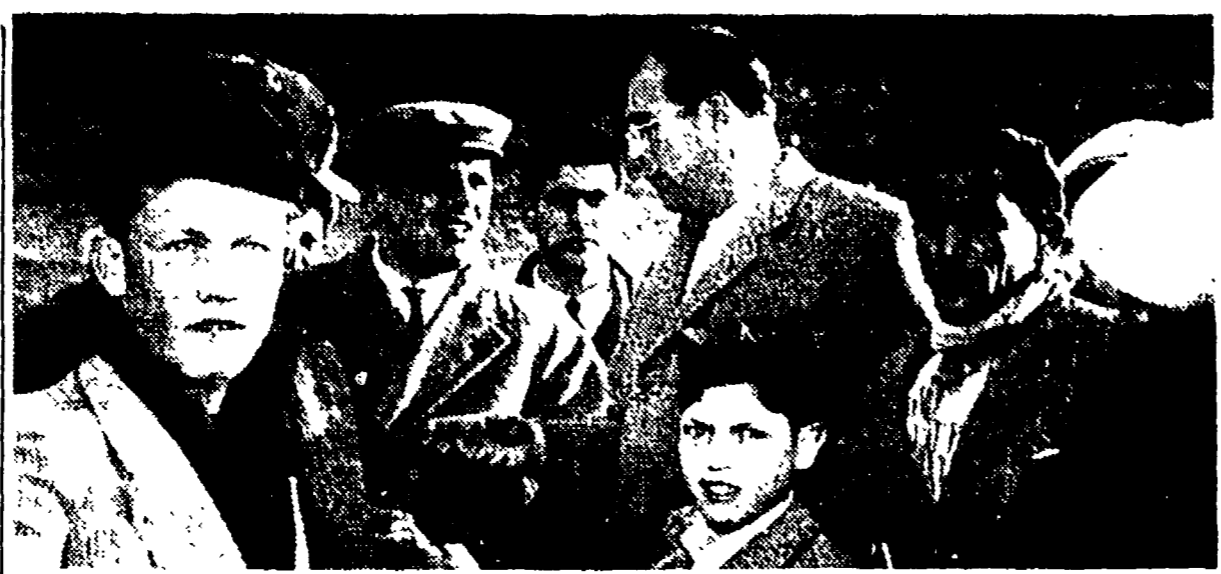
PARTINICO — Danilo Dolci (al centro, con gli occhiali) fra i disoccupati

Corrado Cagli, la Federbraccianti nazionale, eccettuato dispettoso appello, se ha commosso per scrittori, registi ed uomini di cultura, ha lasciato indifferente il governo. E questa mattina, nello stesso Partinico, ha lasciato indifferente il governo. E questa mattina, nello stesso Partinico, ha lasciato indifferente il governo.