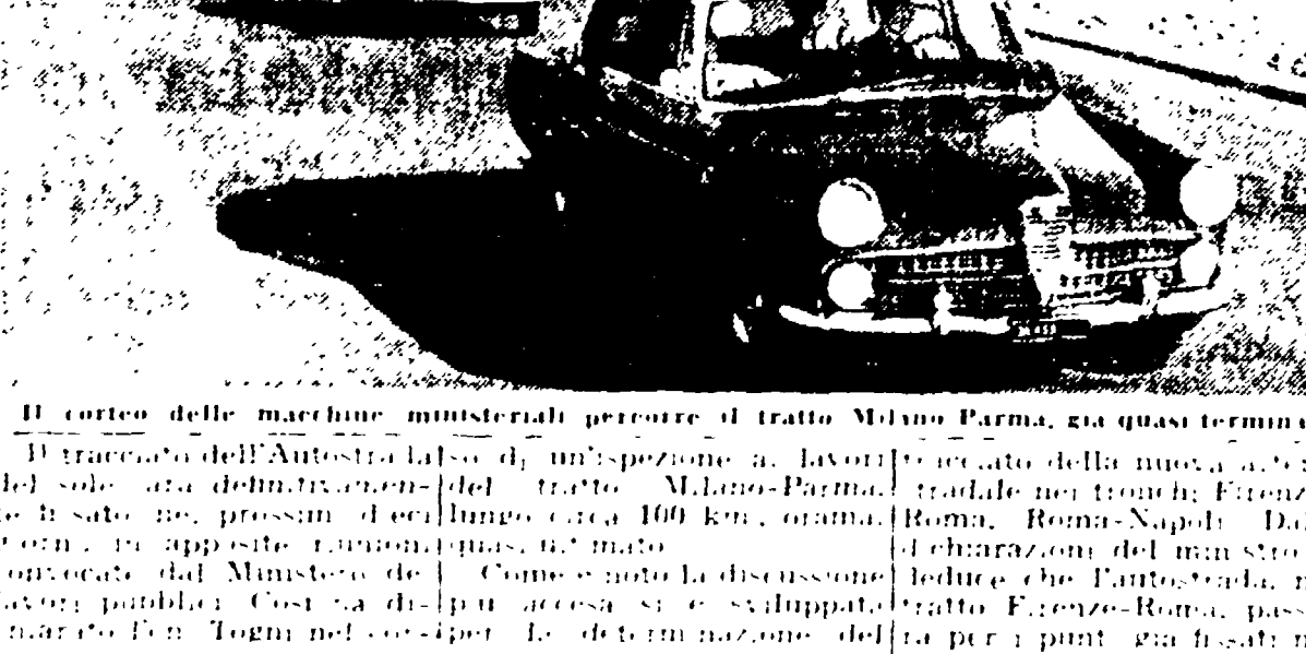
Il corteo delle macchine ministeriali percorre il tratto Milano-Parma, già quasi terminato.

I tronchi Firenze-Roma e Roma-Napoli passeranno per i punti previsti