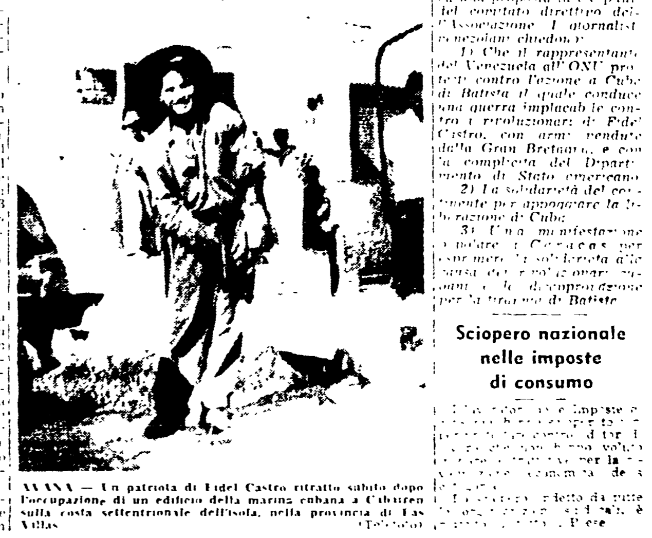
AVANA - Un patriota di Fidel Castro ritratto subito dopo l'occupazione di un edificio della marina cubana a Cabaigen...