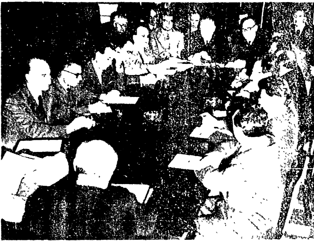
L'incontro fra il governo e gli statali. Si riconoscono di spalle in primo piano il presidente del Consiglio Fanfani e di fronte i segretari confederati Novella...

Mille lire di aumento per la moglie e i figli - La "scala mobile", ne darà al massimo altre 1600