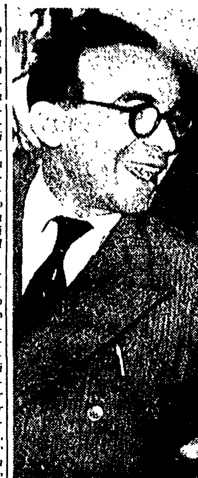
L'on. La Pira

MOSCA, 26 — « Tutto ciò che ho veduto parla della libertà di religione del vostro paese... »