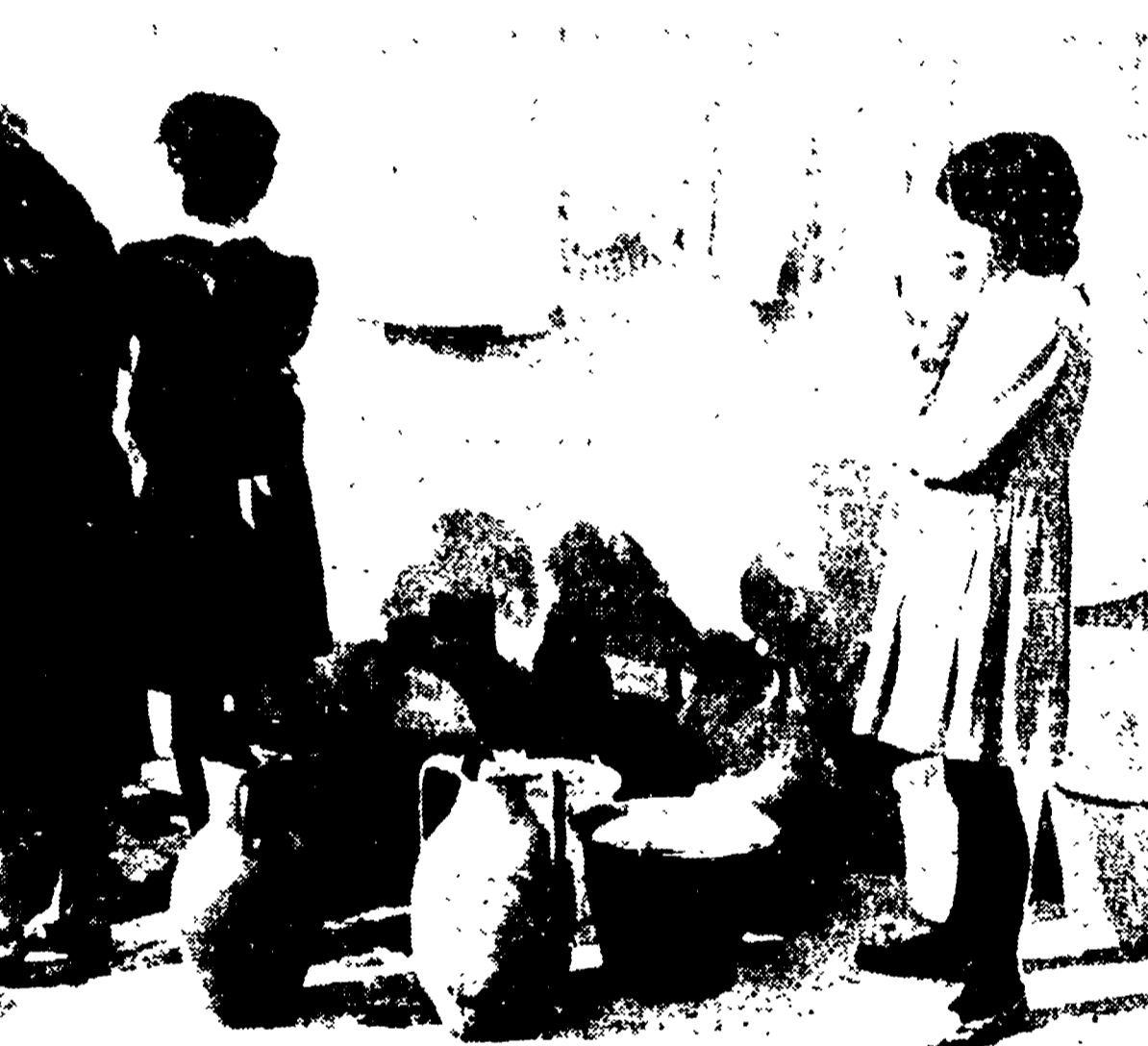
Montescaglioso: si attende che dal fontanino esca un po' d'acqua.

Non è un fatto di stagione, d'estate quando aumentano i consumi e l'acqua scarseggia, o d'inverno quando diminuiscono i consumi e l'acqua viene erogata per poche ore al giorno, come nelle città della Puglia e nella Sicilia o nel Garofano. Qui l'acqua non c'è mai. Ora di lavoro, sudore, lacrime e bambini si sprecano in un traffico che stanca e arruina, in trasporti d'acqua con botti e autobotti, secchi e recipienti di plastica che fanno bella mostra davanti ad ogni casa colta. A volte si tratta di tre, quattro, e cinque chilometri di andata e altrettanti per il ritorno, quando il cammino è più faticoso perché si è carichi. Questo cammino quotidiano, che dura da sempre e che massacrante è ripetuto ora, da quindici anni, da quando questa campagna è cominciata a essere abitata, non lo si può vedere dalla statale per Regno Calabria. Il dramma è nascosto. A chi visita le centrali ortofrutticole o le centrali del latte che si affacciano sulla statale