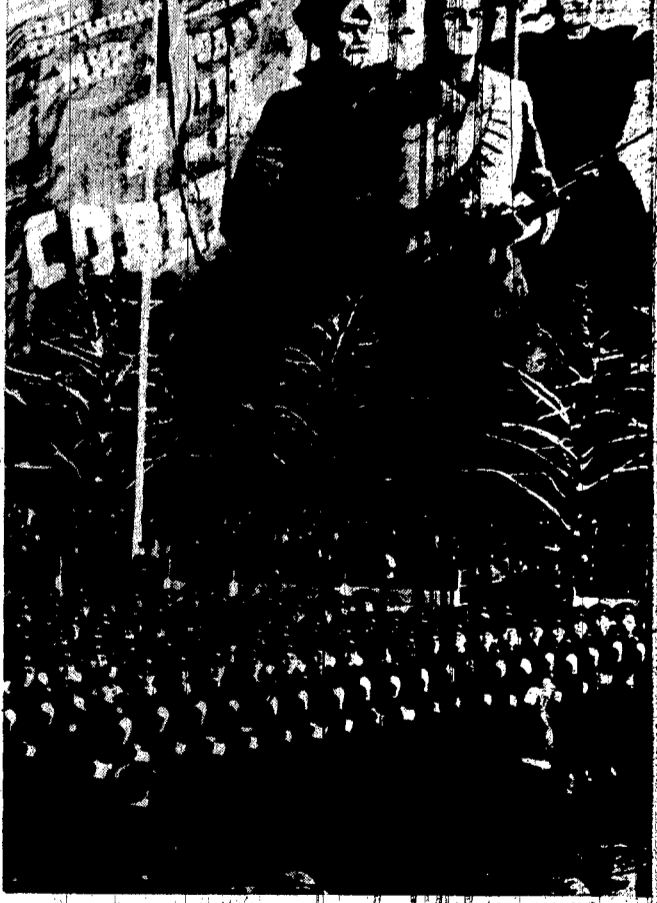
Mosca: un reparto sovietico sfilava sulla piazza Rossa durante il grande parata nel cinquantesimo anniversario della rivoluzione d'Ottobre. Sullo sfondo: cortei e sfoghi di propaganda.

Un duro discorso del maresciallo Grechko, di cui è imminente un viaggio a Cuba - Nessuna novità negli armamenti