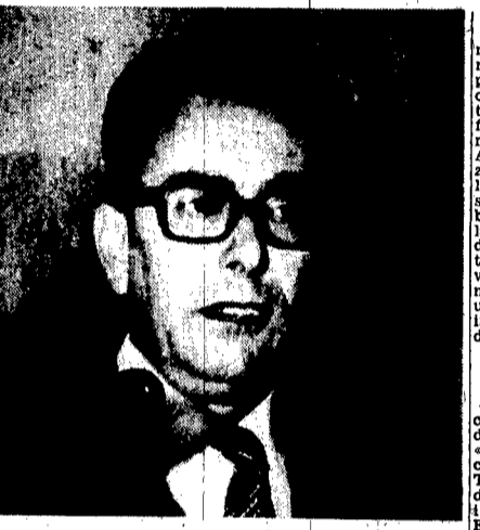
Roma: l'onorevole Forlani mentre pronuncia il suo discorso al consiglio nazionale della democrazia cristiana.