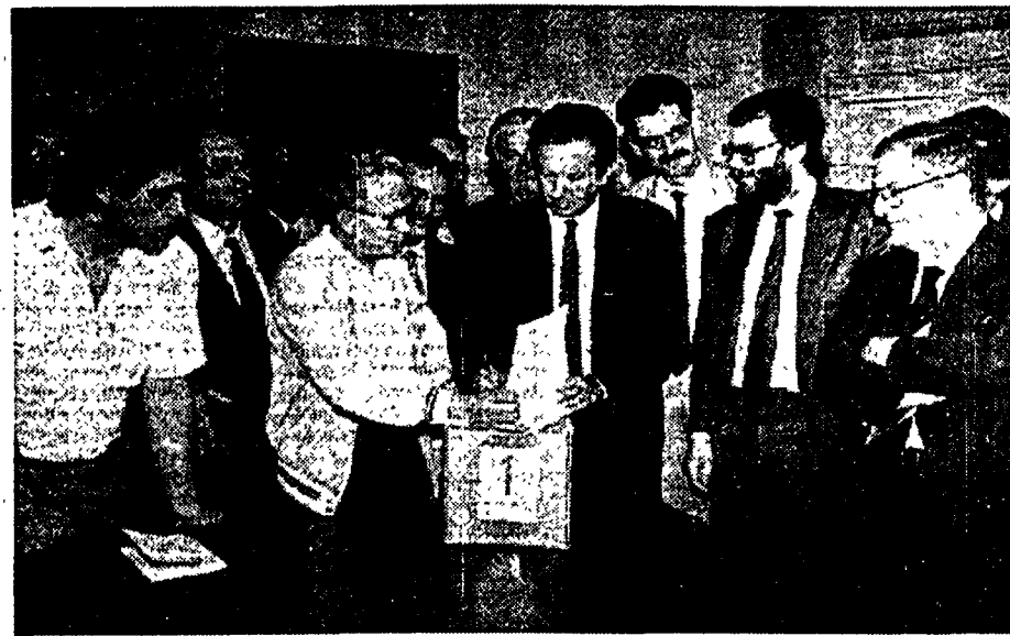
Consegnati ieri alla Corte di Cassazione delle firme raccolte per i referendum istituzionali

608 mila firme per il referendum sulla legge elettorale del Senato, 605 mila per gli altri due. I promotori hanno consegnato le schede ieri mattina all'ufficio elettorale della Corte di Cassazione. Mario Segni: «Questa battaglia investe un problema essenziale della democrazia italiana: la riforma della politica e dello Stato». Circa 200 mila firme raccolte dal Pci.