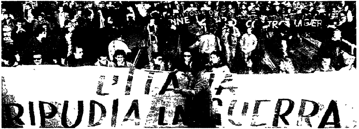
Lo striscione alla testa del corteo per la pace; sotto la manifestazione a Stoccarda contro la guerra

Ieri in tutta Italia manifestazioni contro l'intervento militare. Nella capitale per quattro ore gli slogan d'un popolo nonviolento: Pci, ambientalisti, Dp, obiettori «Tutti a terra: si simula l'eccidio»