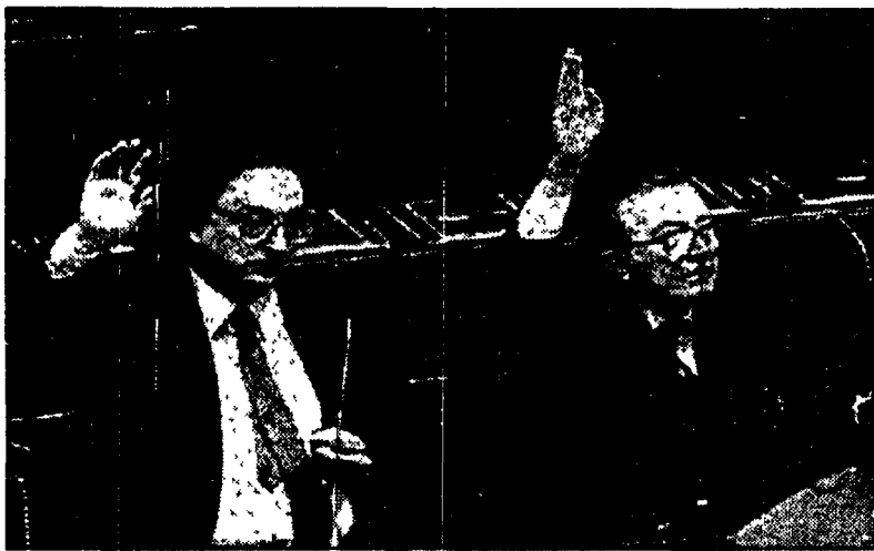
De Michelis e Andreotti votano alla Camera, sul Golfo

nima pacifista del mondo cattolico. «Il tempo ci darà ragione», è il leit motiv dell'intervista, che cerca però di recuperare così il disagio delle giovani generazioni: «Non sottovaluto certamente gli aspetti costruttivi di una cultura della pace e di un ripudio della violenza». Ma a Cesare le armi, a Dio la cura delle anime. Le telefonate erano cominciate prestissimo, ieri. Prima di intervenire alla Camera, poco dopo le 9 del mattino, per la replica nel dibattito parlamentare, Andreotti aveva avuto una serie di contatti con il premier inglese Major, con Hitterrand e con Kohl. Era anche da una impressione comune che nasceva il «moderato ottimismo» espresso dal presidente del Consiglio in apertura di governo, a quanto si sa, di un brevissimo consiglio dei ministri, svoltosi nelle stanze del