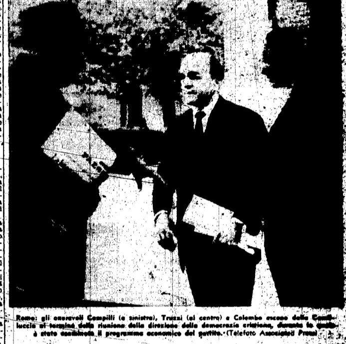
Roma: gli onorevoli Campilli (a sinistra), Truzzi (al centro) e Colombo eccolo della Camera al termine della riunione della direzione della democrazia cristiana, durante la quale è stato esaminato il programma economico del partito.

Proteste di Scabia. Quest'ultimo aveva indirizzato in precedenza all'onorevole Moro e al presidente del consiglio nazionale Piconi una energica protesta per il modo in cui si era proceduto alla elaborazione del programma di governo.