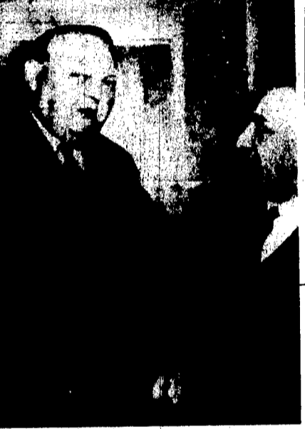
Il ministro tedesco dell'Economia, Ludwig Erhard, con il Presidente del Consiglio Fanfani durante il pranzo svolto l'altra sera al Quai d'Orsay, a Parigi.